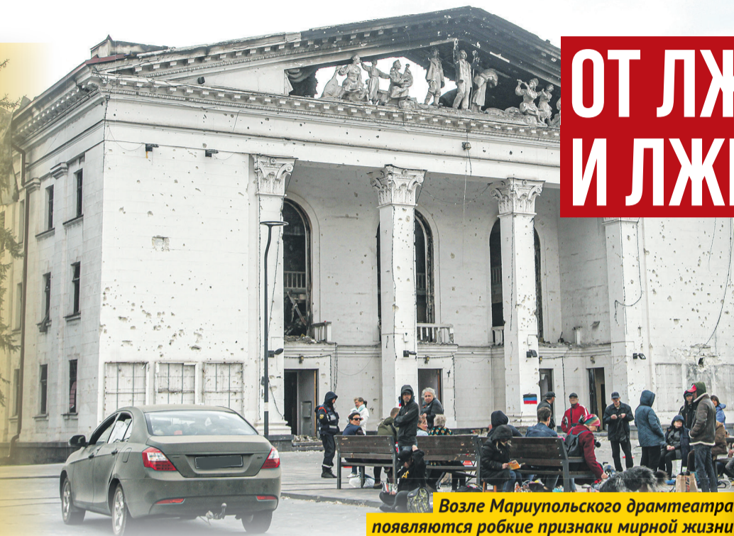
Возле Мариупольского драмтеатра появляются робкие признаки мирной жизни